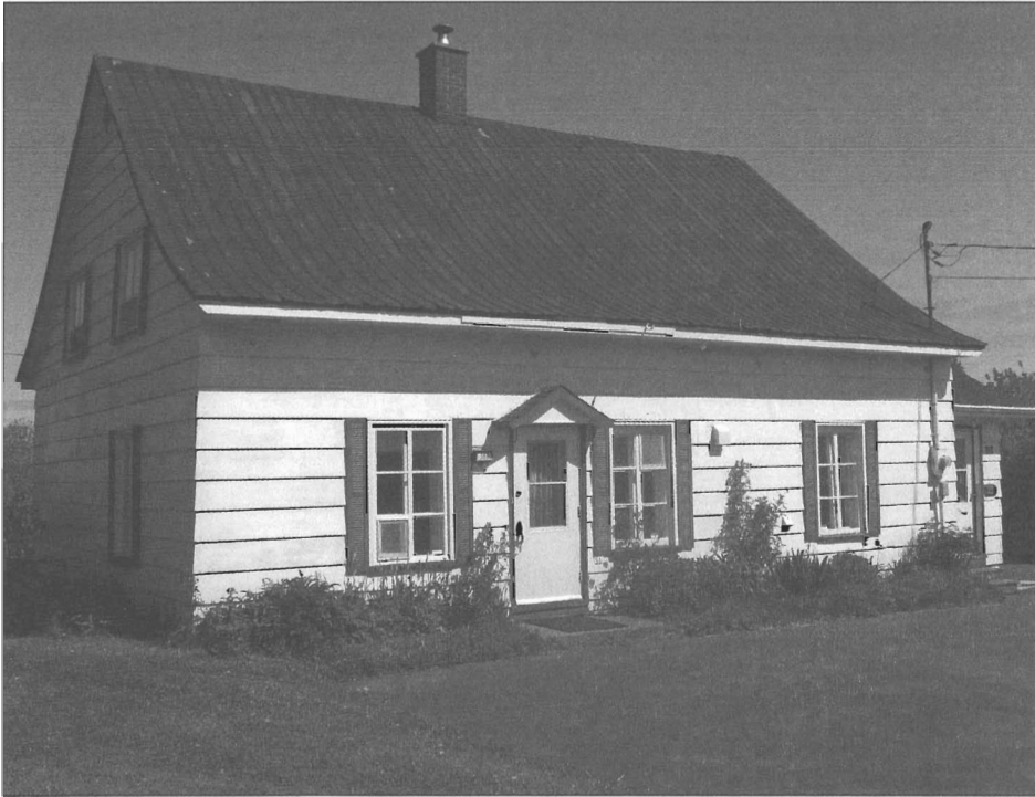
« Maison Perron ».

Pour revenir à la tradition historiographique qui veut que la maison Perron ait été construite dans le premier bourg rimouskois, au temps de la Nouvelle-France, notons qu'en 1996, sur la foi des contrats de mariage des anciens propriétaires des lieux 18 , l'abbé Gabriel Langlois publiait un article se concluant sur ces mots :