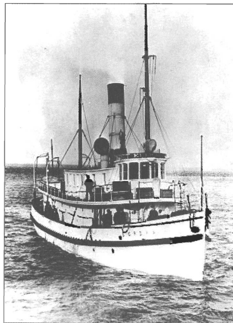
L' Eureka.

L'épave du Germanicus est couchée sur son côté tribord. La distance qui la sépare de la rive est de 9,6 km, ce qui signifie environ 20 minutes en mer. Immobile à quel-