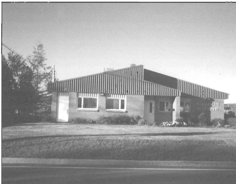
L'édifice municipal de Saint-Donat qui sert de bureau de votation lors des élections (photo Rémi Saint-Laurent).

Durant cette période décisive pour l'avenir du Canada, la Cour suprême rend un jugement dans l'épineux dossier linguistique. Le 15 décembre 1988, elle invalide les dispositions de la loi 101 sur la langue d'affichage soi-disant contraire à la liberté d'expression. C'est la troisième fois que le