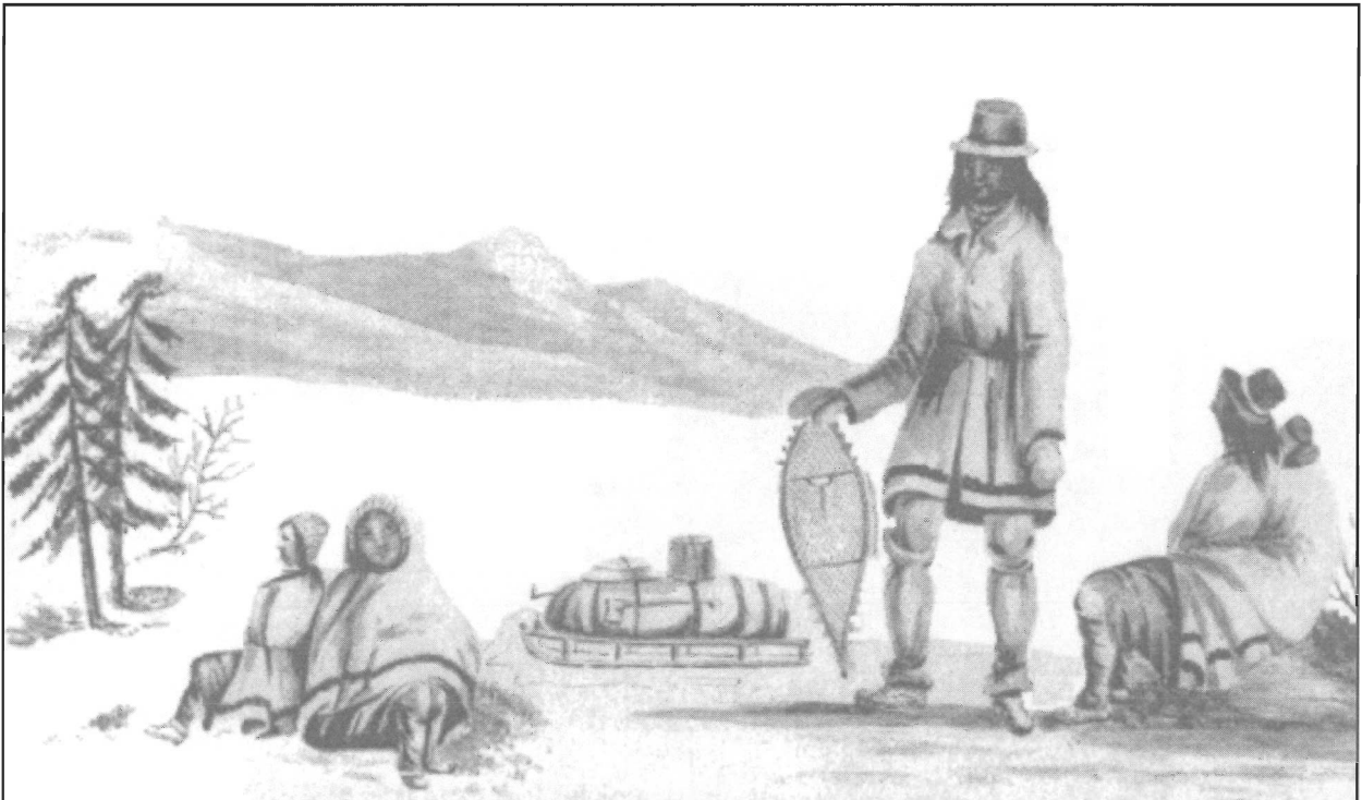
Un costume éclectique chez les membres de la tribu de Listuguj.

Si on en revient à l'année 1811, quand les familles micmaques se sont éparpillées sur la côte est du Québec et du Nouveau-Brunswick, certaines se sont installées à l'extrémité de la péninsule gaspésienne. Ces dernières perdent rapidement le contact avec les communautés autochtones de la