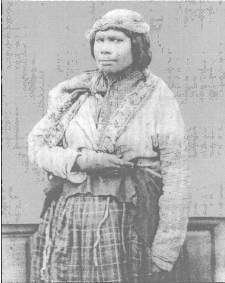
Indienne micmaque en 1857. Les femmes micmaques de la Gaspésie ont déjà, en 1831, adopté les vêtements de la communauté blanche, comme c'est le cas pour cette jeune Autochtone d'Halifax une vingtaine d'années plus tard.

Ce mélange de wigwams en écorce et de maisons de planches s'explique par le fait que Listuguj «est beaucoup plus une base de chasse et de pêche qu'un lieu de résidence permanente» , écrit l'historien L. F. S. Upton 46 . Là où le peuple micmac de la Gaspésie ressent, cependant, les plus forts assauts de la culture blanche, c'est dans ses droits de pro-