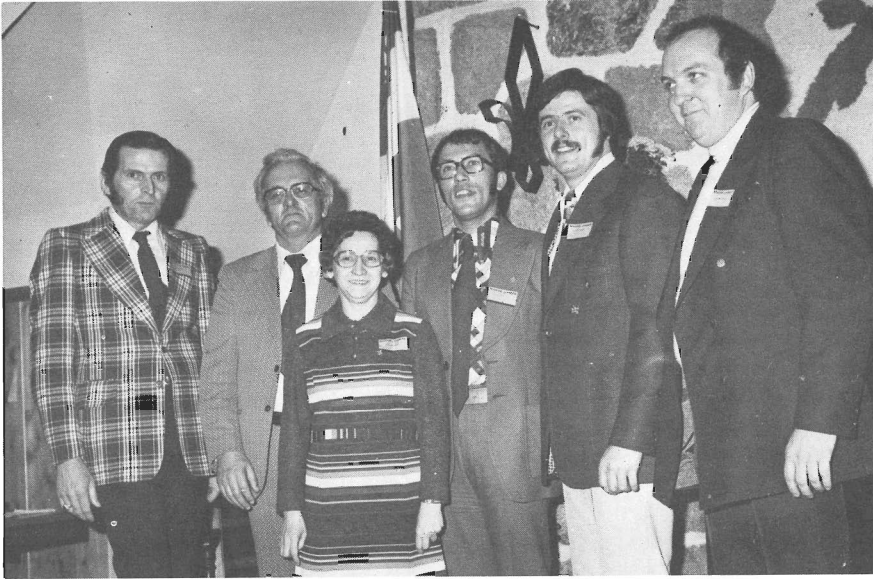
1975 - Conseil Exécutif de la SNEQ