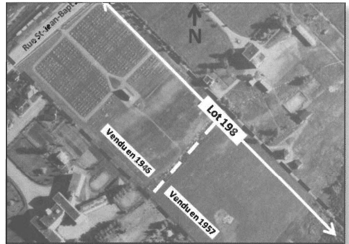
Figure 2. Différences entre deux phases de vente du lot 198 pour la création du cimetière. Figure réalisée avec une photographie aérienne de 1968 du Ministère des Terres et des Forêts du Québec.

Rimouski, qui convoitait ces terrains, équivalant à environ la moitié de la propriété des Sœurs, pour un futur développement résidentiel. Cette année marque aussi la fin de l'exploitation avicole 31 . Entre 1990 et 1993, l'Université du Québec à Rimouski achète des terrains et des bâtiments de ferme, soit la grange-étable et le poulailler 32 . En 1996, la première phase du projet de développement domiciliaire de la Ville débute par la mise en vente de terrains dans la nouvelle zone, nommée Les Prés du Saint-Rosaire 33 . La présence de la congrégation dans ce nouveau secteur est commémorée par l'utilisation de noms de Sœurs en tant qu'odonymes; ainsi y croise-t-on par exemple les rues Elmire-Roy et Élisabeth-Turgeon 34 . En 2003, la vente à un particulier des terrains restants, situés au sud de l'autoroute 20, est conclue. En 2007, des terres plus proches de la maison-mère sont vendues. En effet, la partie est des terres situées entre la 2 e Rue et le chemin agricole derrière la maison-mère – traditionnellement nommé « chemin du rucher » – est vendue à la Ville, tandis que la partie ouest est donnée pour la construction de la maison de fin de vie Marie-Élisabeth 35 . Malgré les ventes successives de terrains, la maison-mère