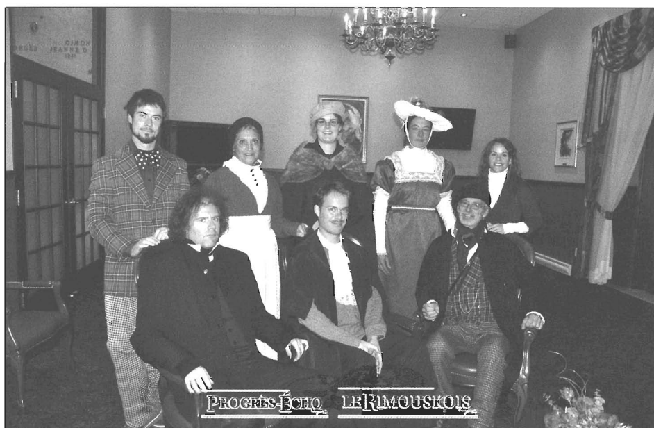
Personnages de la promenade nocturne dans le cimetière Saint-Germain

Mandatée par la Ville de Rimouski, la SRP met en application un programme d'aide financière pour les bâtiments situés dans les sites reconnus patrimoniaux ou dans des secteurs de la ville à valeur patrimoniale. Elle offre aux Rimouskois un service pour les conseiller dans la rénovation et la restauration de leur bâtiment. Un centre de documentation, un répertoire des artisans et une matériauthèque sont aussi mis à leur disposition. Par le biais de son service-conseil et de ses outils de sensibilisation, la SRP recommande aux propriétaires des interventions qui visent à préserver et à mettre en valeur les caractéristiques d'origine des bâtiments. Elle peut ainsi