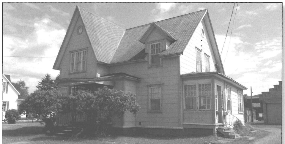
Maison Bernard, au 317, rue St-Germain Est

La première est sise sur la rue Saint-Robert; cette demeure ayant un caractère patrimonial et historique exceptionnel, une demande de protection a été faite suite à sa mise en vente sur le marché de l'immobilier. Il faut savoir que le zonage du territoire