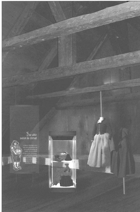
Un projet de renouvellement d'exposition inédit et ludique (SRP-2011).

Le rez-de-chaussée de la Maison Lamontagne est meublé d'objets et de mobilier du XVIII e siècle évoquant la vie rurale en Nouvelle-France. Par le biais de ces objets, de ce mobilier et de certaines compo-