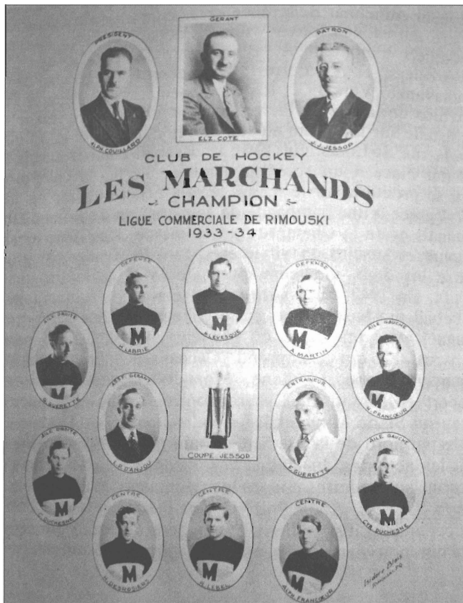
« Le club de hockey Les Marchands », photographe Isodore Blais, parue dans Le Progrès du Golfe , 16 février 1934, p. 1.

semble provoquer un désintérêt pour le hockey régional. Les différentes tentatives pour relancer la LHBSL se soldent par des échecs. De plus, des villages tels qu'Amqui ou Sayabec ne sont pas en mesure de former des ligues locales, puisque leurs meilleurs joueurs sont recrutés par les commerces rimouskois. Dans l'ouest du Bas-Saint-Laurent, les ligues locales ont plus de facilité à cohabiter. En plus de la Ligue de la Cité à Rivière-du-Loup, des ligues sont présentes à La Pocatière et