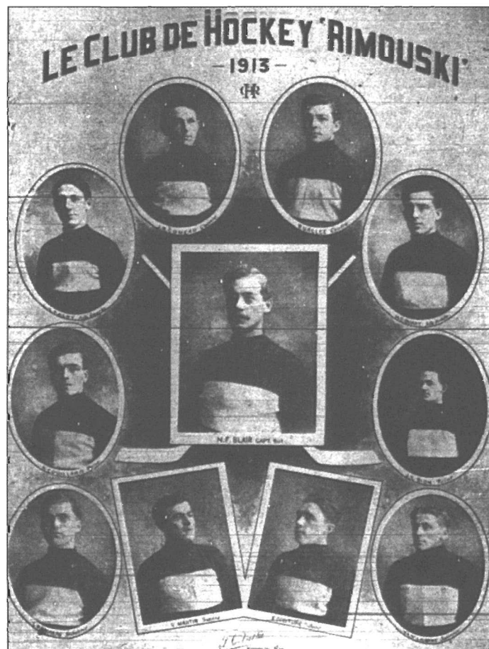
« Le club de hockey Rimouski 1913 », photographe inconnu, parue dans Le Progrès du Golfe , 23 janvier 1948, p. 8.

L'hiver suivant, le Canada and Gulf Terminal Railway relie par chemin de fer Rimouski et Matane, ce qui met fin à l'isolement hivernal entre l'est et l'ouest de la région et permet l'organisation de premières parties amicales entre différentes localités du Bas-Saint-Laurent. Constatant l'intérêt de la population pour ces affrontements intrarégionaux, une première ligue de hockey est fondée en 1912 : la Lower St-Lawrence Amateur Hockey League 8 . Celle-ci, dont le nom est francisé l'année suivante, comprend les clubs de Rimouski, Métis, Sainte-Flavie et Matane. Les équipes ne sont formées que de sept joueurs (un gardien, deux défenseurs, trois avants et un maraudeur) et ceux-ci demeurent sur la patinoire durant toute la confrontation. Les saisons, qui débutent au début janvier, ne sont que de cinq parties.