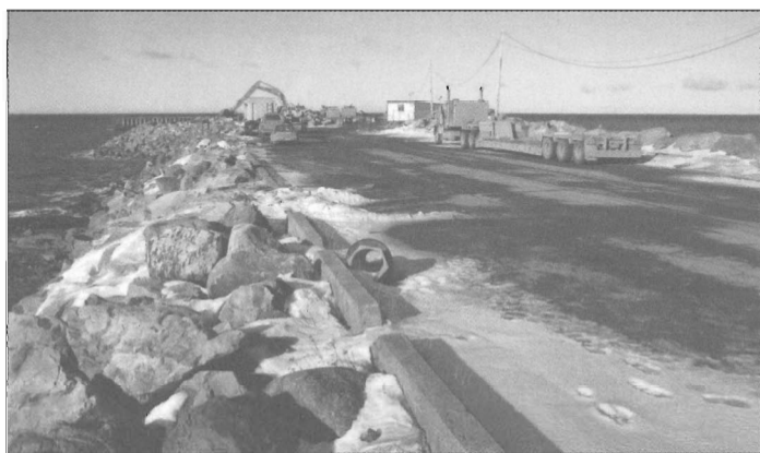
Les travaux de démolition du quai de Pointe-au-Père se poursuivent à l'automne 2006 (Jean Larrivée, 2006)