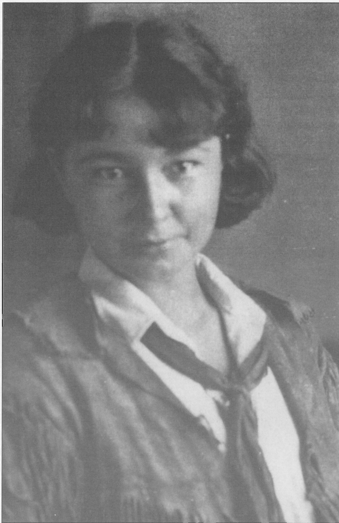
Anahareo à l'âge de 25 ans (Lovat Dickson, Grey Owl, l'homme qui voulait être Indien, Montréal, Les Éditions de l'Aurore, 1977, photo 26).

Après avoir fait soigner leurs castors par le médecin de Cabano, un