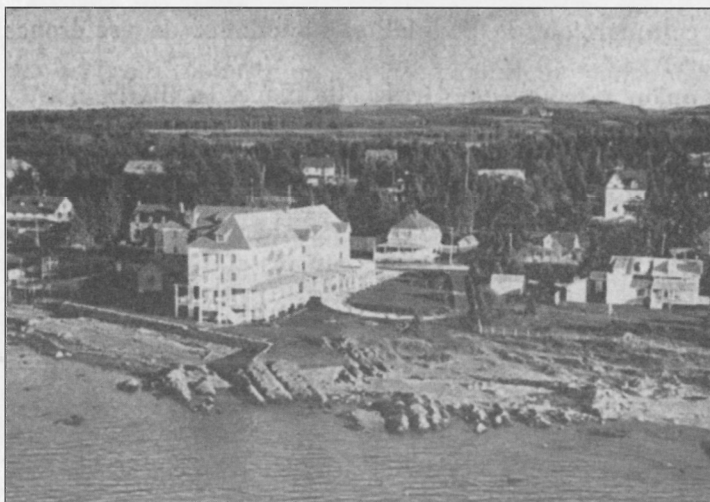
Métis-sur-Mer (La Gaspésie, histoire, légendes, ressources, beautés, 1930, p. 67).

Nous y arrivâmes avec notre dollar habituel, plus soixante-neuf cents en poche, pour découvrir bientôt qu'une tournée de conférences risque de ne pas être une entreprise d'un très grand rapport financier, lorsqu'on s'y lance démuné de certains petits accessoires, tels qu'un