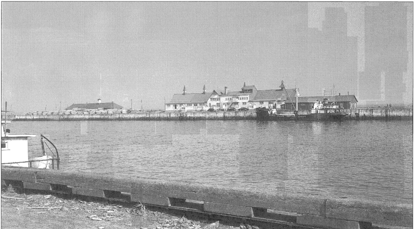
Quai de Rimouski-Est vers 1949.

Cependant, la prospérité locale est menacée, car l'industrie forestière est en déclin. Les années records de forte production de la guerre vont même accélérer la crise des approvisionnements. Les auteurs de l' Inventaire des ressources naturelles avait énoncé le problème comme suit :