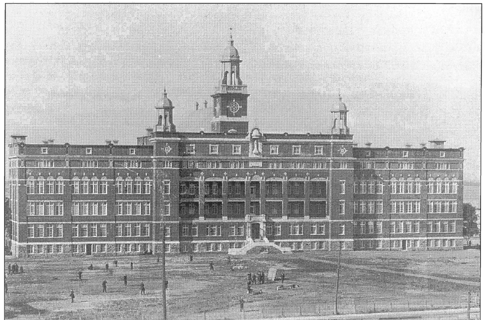
Le Séminaire de Rimouski après 1925.