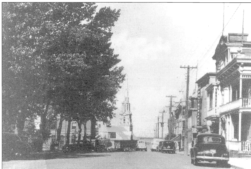
Rue de la Cathédrale.