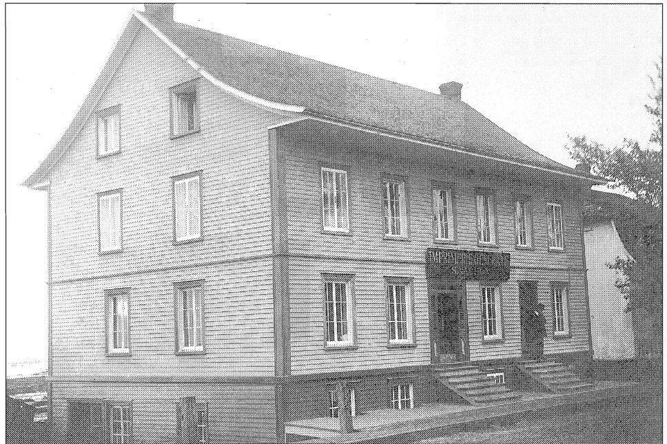
Imprimerie Vachon de la rue Saint-Germain où était imprimé Le Progrès du Golfe à compter de 1904 (UQAR : collection Pineau).

L'émergence de l'Association des propriétaires de Rimouski, une sorte de comité de citoyens formé exclusivement de propriétaires, illustre les tensions et les résistances suscitées par les changements rapides des dernières années.