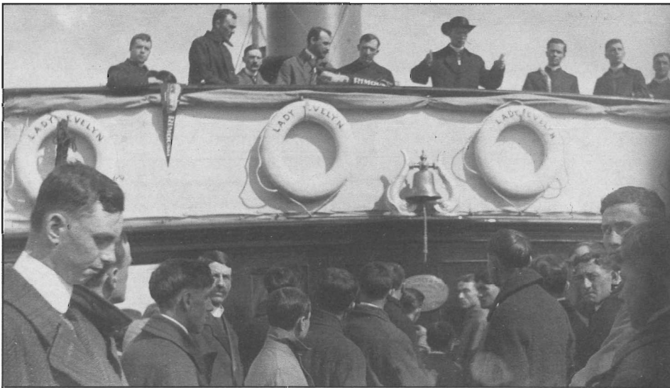
Le 13 juin 1914, des prêtres et des élèves du Séminaire accompagnent un groupe de Rimouskois pour un service funéraire sur les lieux du naufrage de l'Empress of Ireland survenu le 29 mai 1914 (carte postale).

En 1906, six prêtres séculiers et deux pères Eudistes français se partageaient l'autorité au Séminaire. Ces religieux, qui consacraient leur vie à l'enseignement, devaient s'occuper d'environ 126 élèves en 1906 et 180 en 1914.