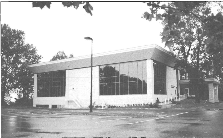
Bibliothèque actuelle construite en 1991.

l'inauguration de la bibliothèque de la Jeune Chambre :