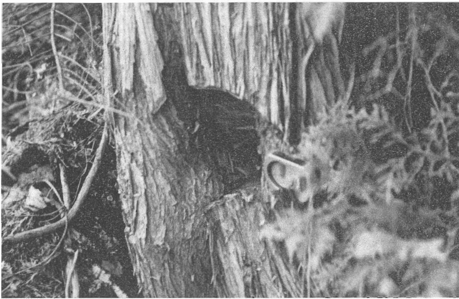
Arbre partiellement coupé en 1908. La boussole donne l'échelle.

l'information sur l'arbre blessé et son environnement. Entre 1908 et nos jours, le diamètre de l'arbre s'est accru d'une dizaine de centimètres, masquant une partie de l'encoche taillée par le bûcheron. Dans le même temps, on enregistre des changements importants dans l'environnement, tout particulièrement en ce qui a trait à la fréquence des avalanches, qui a considérablement augmenté depuis 1940. A chaque année, comme j'ai pu le constater à maintes reprises, les avalanches transportent dans la forêt des quantités impressionnantes de pieraille, enfouissant peu à peu la base des troncs d'arbre. Résultat: depuis 1908, la surface du sol entourant l'arbre blessé s'est élevée de 55 centimètres environ.