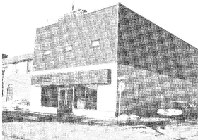
Le Centre régional d'archives.