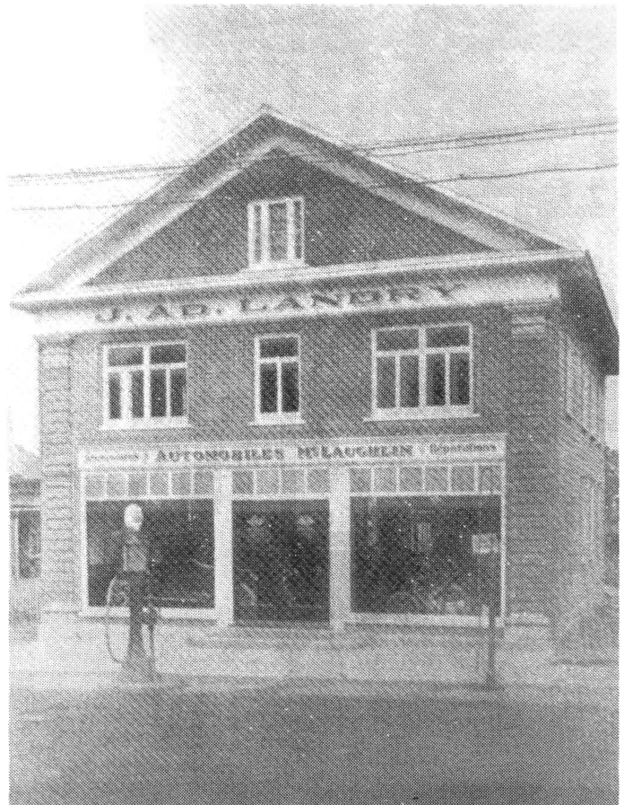
GARAGE J.-A. LANDRY DE MONT-JOLI