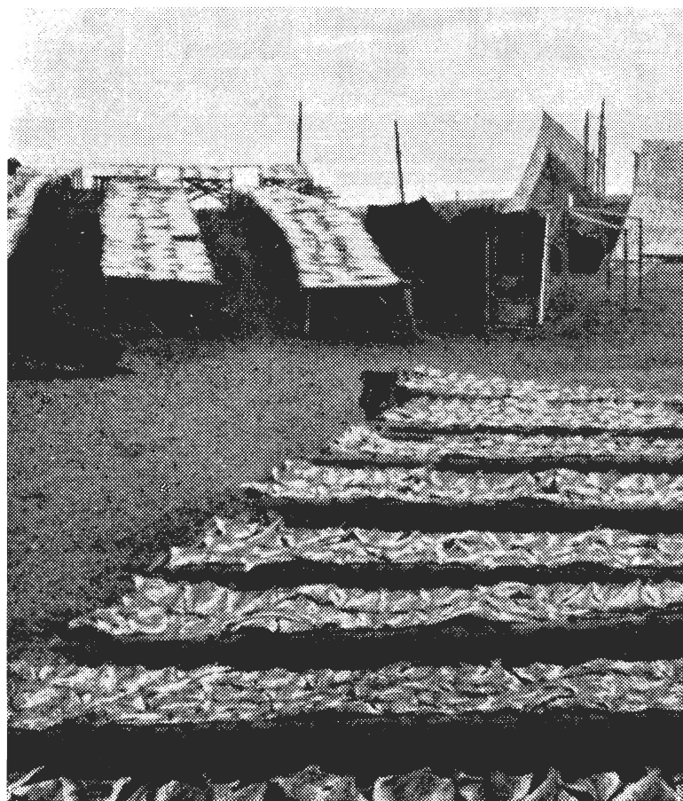
Morues séchées exposées sur les "vignaux".

Plus loin à l'est et au sud jusqu'à Paspébiac, là où les ouvertures de la côte ont donné de meilleurs havres au pêcheur, la "barge de Gaspé" ou barge de Miscou est à l'honneur. Plus grosse et plus robuste que la petite barque, elle en a épousé les formes avec ses flancs arrondis, sa coque aux lignes effilées, son arrière élevé sur lequel se brisent les vagues à l'approche de la côte. Pontée, munie d'une voile et presque toujours d'un moteur de 10 à 12 CV, la barge est montée par trois ou quatre hommes. Sa construction, une tâche ardue accomplie avec des moyens artisanaux, débute à l'automne avec la coupe du bois