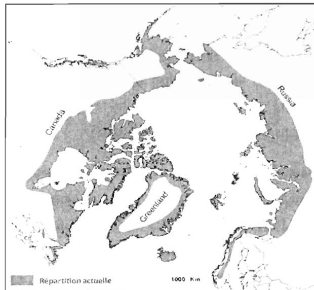
Figure 1: Tiré de Angerbjörn et al. (2004): Répartition circumpolaire du renard arctique.

Le renard arctique ( Vulpes lagopus ) est le plus petit canidé homéotherme restant actif durant l'hiver arctique (Audet et al. 2002). Il vit en moyenne de 3 à 4 ans, mais peut parfois atteindre 10 ans (Audet et al. 2002). Il est majoritairement nocturne, mais il peut faire varier ses heures d'activité en fonction de celles de ses proies (Anthony 1997). Il a une répartition circumpolaire qui inclut les zones de toundra de l'Eurasie et de l'Amérique du Nord, la toundra alpine de la Fennoscandinavie, les îles de Svalbard, l'Islande et plusieurs autres petites îles de l'Arctique, de l'Atlantique Nord, du Pacifique Nord ainsi que de la mer de Béring (Prestrud 1991; Angerbjörn et al. 2004) (Figure 1).