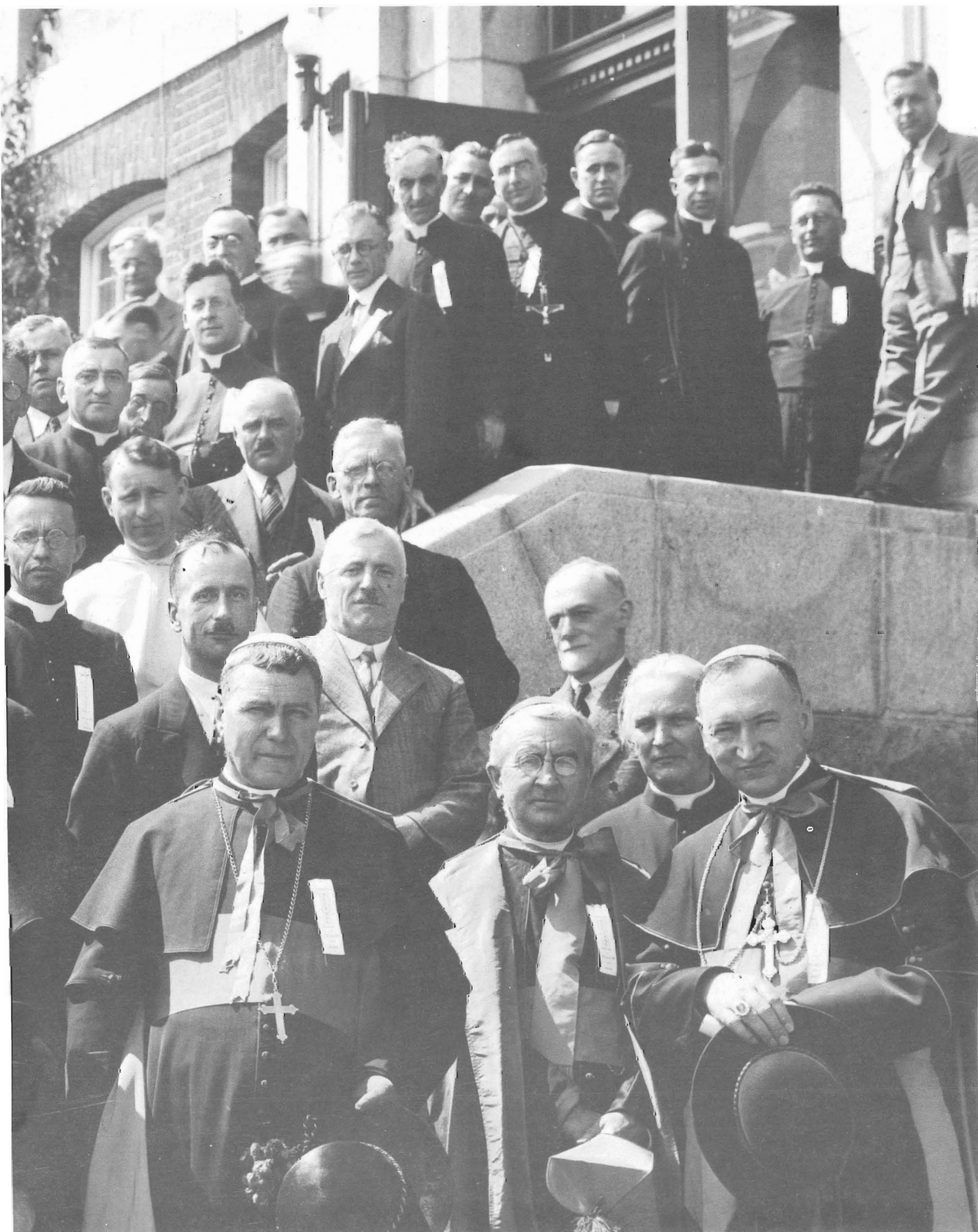
ises de la semaine sociale de Rimouski; en 1933.